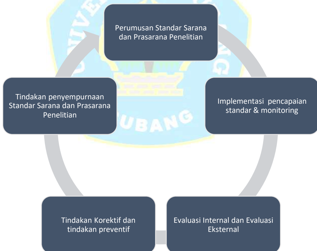
Gambar IV.1 :

Berikut diagram satu siklus penjaminan mutu sarana dan prasarana penelitian :