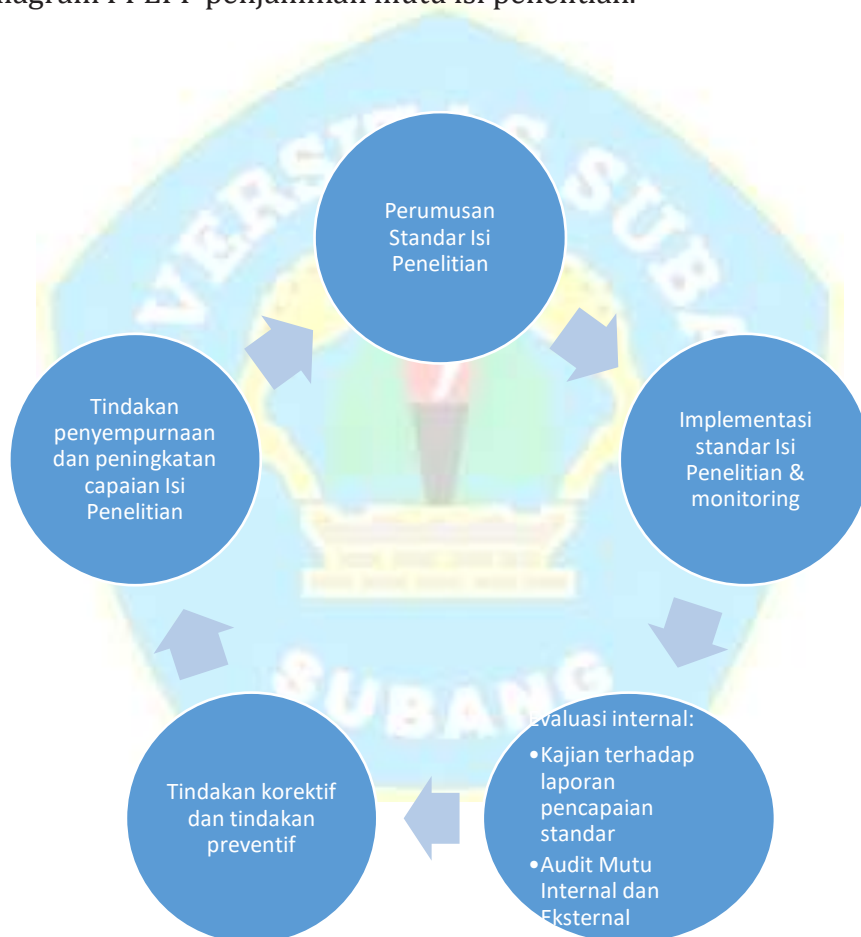
Gambar IV.1 :

Berikut diagram PPEPP penjaminan mutu isi penelitian.